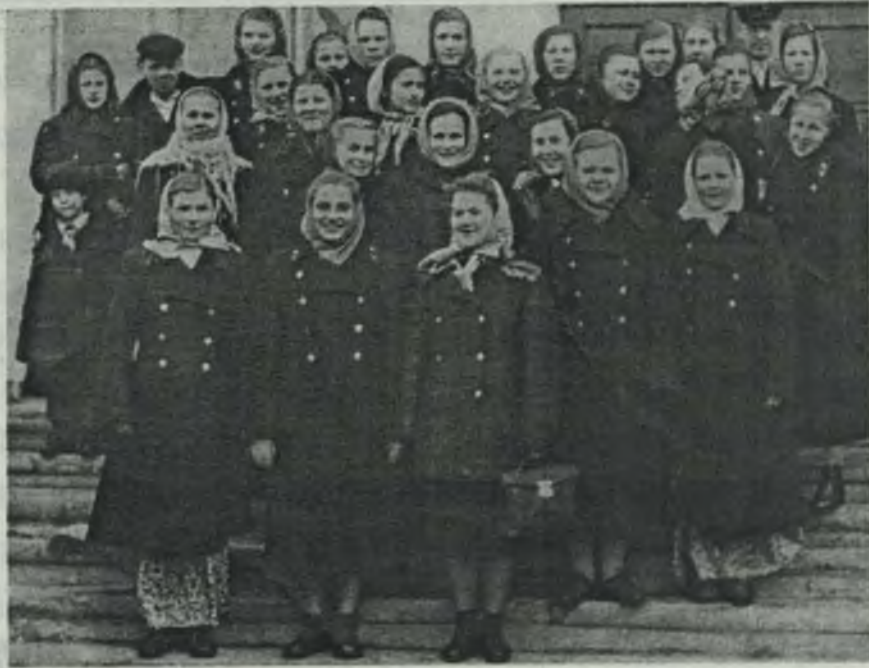
Участники хорового кружка