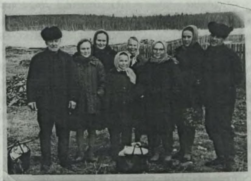
Жители Лубянки. Слева направо.

Немцы были родом с Украины, в основном, из Днепропетровской области. Их вначале угнали в Германию, а затем, как пленных, сослали на Урал. Это были старики, женщины и дети. Очень много умерло в первые зимы, особенно крымских татар. Они были из горных селений, совершенно не говорили по русски. Немцы отличались чистотой и аккуратностью, язык знали. Татары были гостеприимными, почти все работали в колхозе. Вот с детьми этих людей прошли мои детские и школьные годы. Паспорта они получили в 1956 - м году.